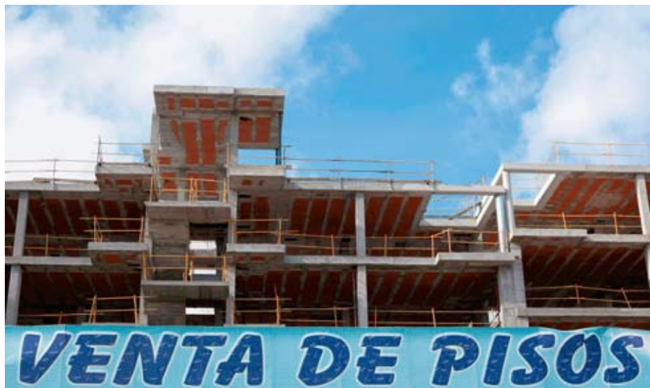
Immobilienzyklen gelten im Allgemeinen als nutzlos oder sogar schädlich. Die aktuelle Krise hat uns jedoch in Erinnerung gerufen, dass sich Schwankungen im Immobiliensektor auf die gesamte Volkswirtschaft auswirken und über Finanzmärkte und Handelsbeziehungen sogar auf andere Länder übergreifen können. Bild: Wohnungen, die in Spanien auf Käufer warten.

Die Immobilienpreise und die Bautätigkeit sind wesentlich stärkeren Schwankungen unterworfen als andere Sektoren der Wirtschaft. Bisher ist es noch schwierig, diese Volatilität zu erklären und Trends genau vorherzusehen. Zwei Faktoren spielen jedoch immer eine Rolle: Vertrauen und Liquidität. Sowohl rationale als auch naive Erwartungen erschweren die Prognose und Analyse dieser Zyklen zusätzlich. Die Schwankungen zu bremsen ist zwar möglich, aber recht heikel.