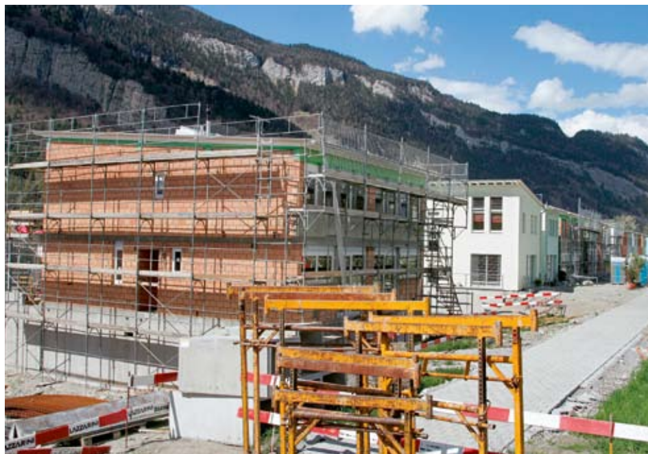
Die durchschnittlich tiefe Wohneigentumsquote der Schweiz bietet bei differenzierter Betrachtung ein heterogenes Bild. Im Bild: Wohneigentumszone bei Chur.