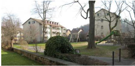
Erstellt durch die Stadt Bern 1945/46

Bauherr: Fonds für Boden- und Wohnbaupolitik Bern